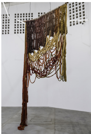
Sororidad , Angélica Serech, Fil de coton et branche naturelle, 400 x 190 cm, 2023. La Galería Rebelde.