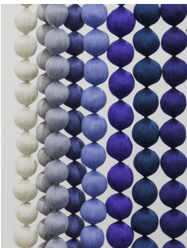
Hacerse invisible , Angélica Serech. Coton, fil et branche naturelle, 147 x 78 cm, 2023. La Galería Rebelde.