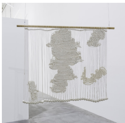
Mapa textil , Angélica Serech. Coton, fil et bois, 150 x 200 cm, 2023. La Galería Rebelde.