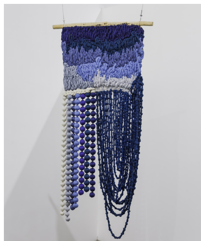
Hacerse invisible , Angélica Serech. Coton, fil et branche naturelle, 147 x 78 cm, 2023. La Galería Rebelde.