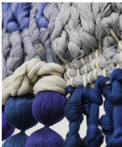
Hacerse invisible , Angélica Serech. Coton, fil et branche naturelle, 147 x 78 cm, 2023. La Galería Rebelde.