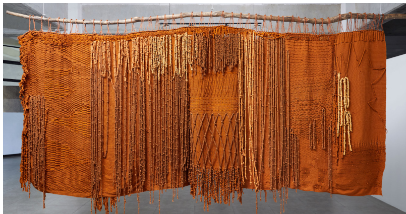
Mi historia en nudos al dorso de mi güipil , Angélica Serech, ceinture tissée et brodée, fil, cheveux et branche d'eucalyptus, 200 x 400 cm, 2021. Fundación Paiz para la Educación y la Cultura.